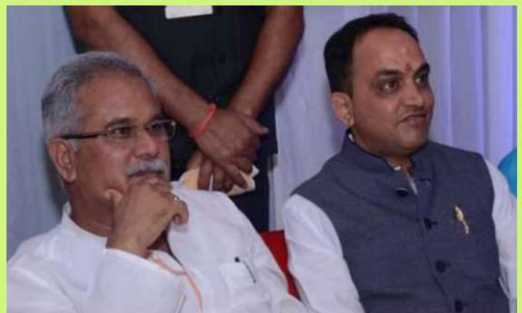
कार्यक्रम में उपस्थित मा. मुख्यमंत्री महोदय के साथ मा. अध्यक्ष महोदय